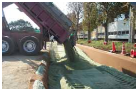
ガラスカレット入りの土を入れて浸透能力がアップ

「雨水は土壌がちゃんと処理してくれます。人工的な排水方法をなるべく使わずに土を活用することが大事なんです」という宮澤さんの言葉が心に残りました。 (長尾愛一郎)