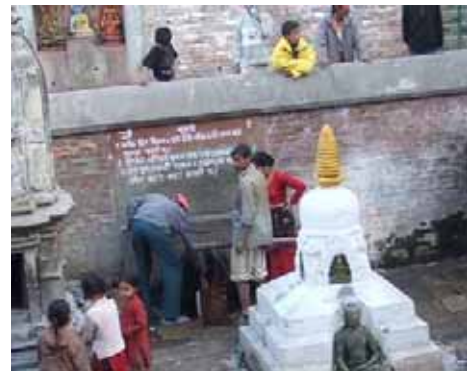
人々が集うカトマンズの共同水汲み場。深さ数mの素掘りの地下水路が張り巡らされ、まちのあちこちにあり。しかしその水は下水で汚染されている。

今後、乾季の間まかなえるだけの容量があるリングタンクの規格化と建設に関するマニュアル化を図っていくために、昨年リングタンクを設置した住民に対するアンケート調査を実施したいと考えています。(今関久和)