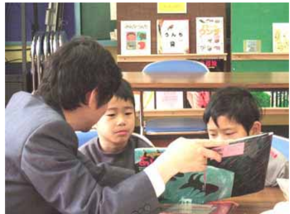
4月1日の読み聞かせ会の様子。