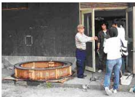
上：完成間近のタンク