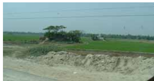
土盛りの上に建つ家々