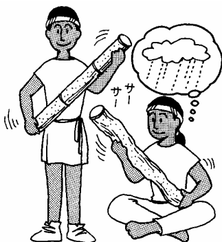
『空と海と大地をつなぐ雨の事典』