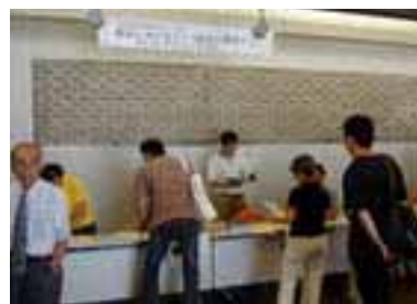
8月7日(土)、約90名が参加して雨水東京国際会議プレ会議が開かれた。

アジアの中の日本という視点、また日本がとくにアジアにどう貢献していけるのかという視点を持って行動していくことの大切さを教わりました。(笹)