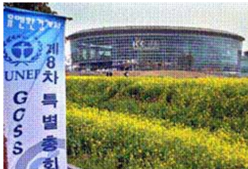
済州島の国際コンベンションセンター