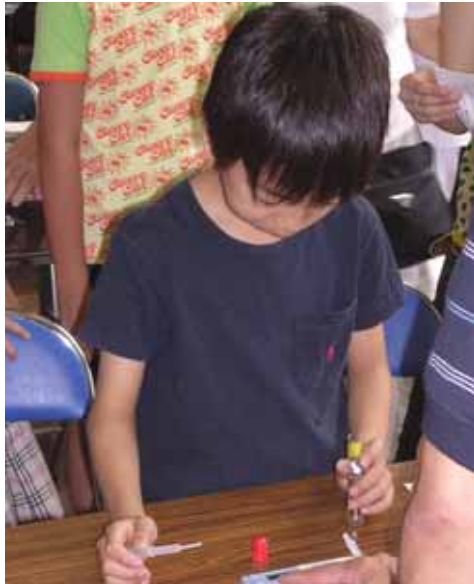
持ってきた雨を真剣な表情で水質検査。

インターネットや新聞で見て、集まった約10人の子もたちが、かなり真剣な様子で水質分析をしました。雨は、自宅、家族旅行した軽井沢、おじいちゃんの家、なかにはマウイ島のものまであり、導電率、pH、二酸化窒素を測定しました。一番きれいと評価されたのは、自宅で台風の日降った雨で、導電率7 \mu S/cm、pH5.7。一番汚いとランク付けされたのは、台風の風が吹いている日に、地元中学の校庭でとった雨で、導電率78 \mu S/cm、pH3.9