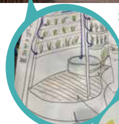
第3回 アイデアスケッチより