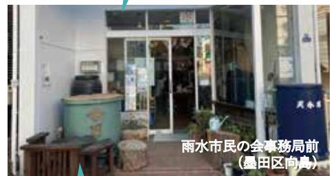
雨水市民の会事務所前 (墨田区向島)